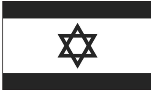
De nationale vlag van de huidige staat Israël.

Het woord "abba", en dus ook de zespuntige ster, zijn de uitbeelding van God de Schepper, Die vanuit Zichzelf, vanuit Zijn Eén, de twee, en daardoor de veelheid van de schepping, voortbrengt.