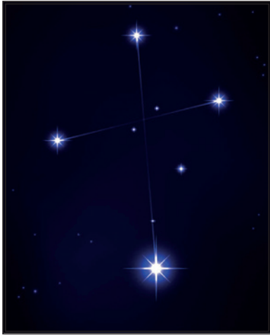
Zuiderkruis / Crux

Dit betekende voor Hem een weg door het zuiden, namelijk een weg van uiterste vernedering, kruisiging en dood. ( Filippenzen 2:6-11 ) Hetgeen ook uitgebeeld wordt in het boven de zuidpool staande sterrenbeeld “het Zuiderkruis”. Daarna werd de HEERE Jezus Christus op grond van Zijn geloof door God opgewekt en tot de uiterste maat verhoogd en verheerlijkt. Hij steeg op naar het noorden en dit wordt zichtbaar gemaakt in het sterrenbeeld in het verste noorden van de aarde, “de Noorderkroon”. Dit Goddelijk plan wordt dagelijks en jaarlijks uitgebeeld in de weg die de zon aflegt in het firmament. ( Psalms 19:2 )