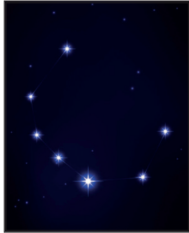
Noorderkroon / Corona Borealis

Vanuit het oosten (= rechts) is Christus, de Wijsheid Gods, geopenbaard in het westen (= links) en dwars door de weg van uiterste vernedering (= zuiden) heen, is Hij weer boven (= noorden), tot de uiterste maat verhoogd en verheerlijkt aan Gods rechterhand.